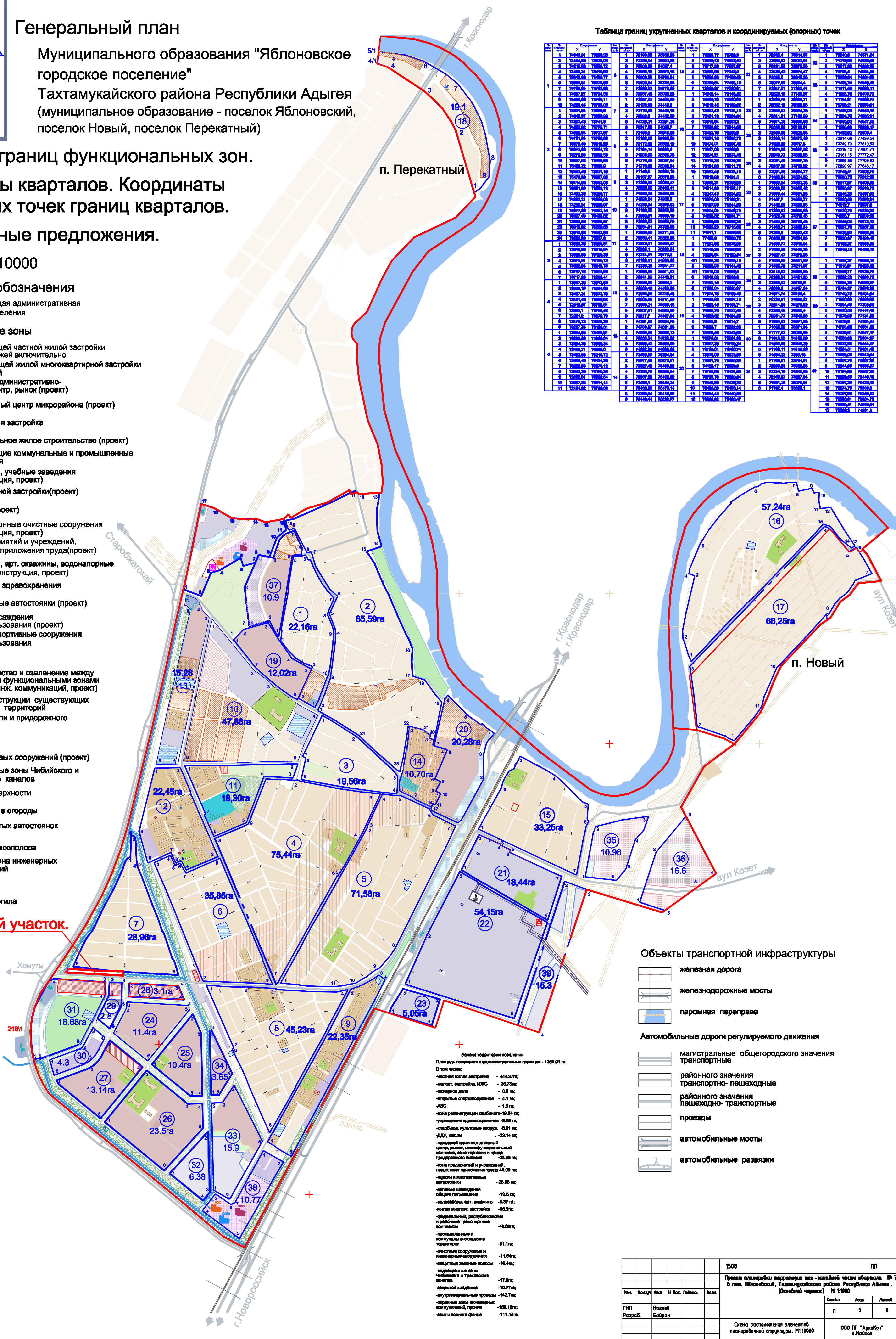
Таблица границ укрупненных кварталов и координируемых (опорных) точек